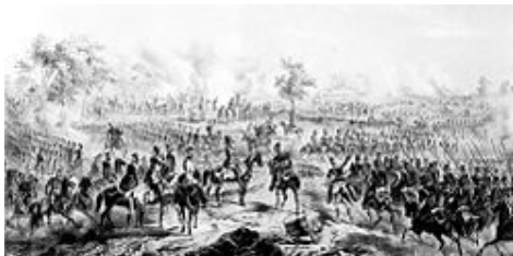
Az 1849-es június 20-i peredi csata

Ám Zsigárdnál hadunk torpan, s önbizalmunk egyre sorvad. S Perednél is csatát veszünk, s elpárolog a jókedvünk.