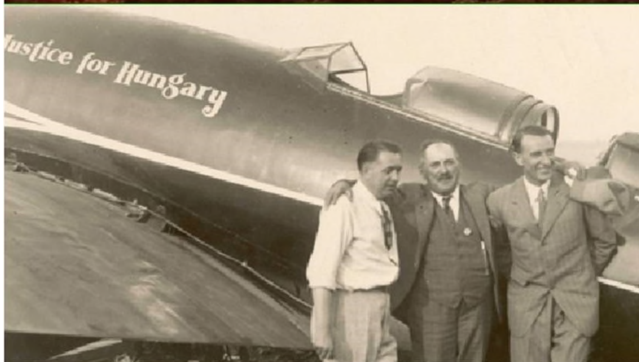
Endresz György pilóta, Magyar Sándor navigátorral magyarként a világon elsőként szállt fel a legendás repülőgéppel és repülte át az Atlanti óceánt 1931. július 15-én