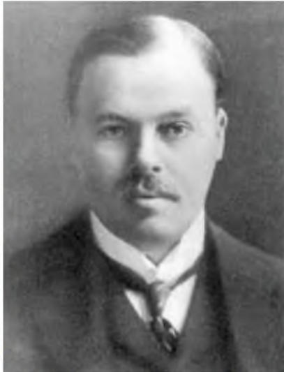
Harold Sidney Harmsworth, 1st Viscount Rothermere