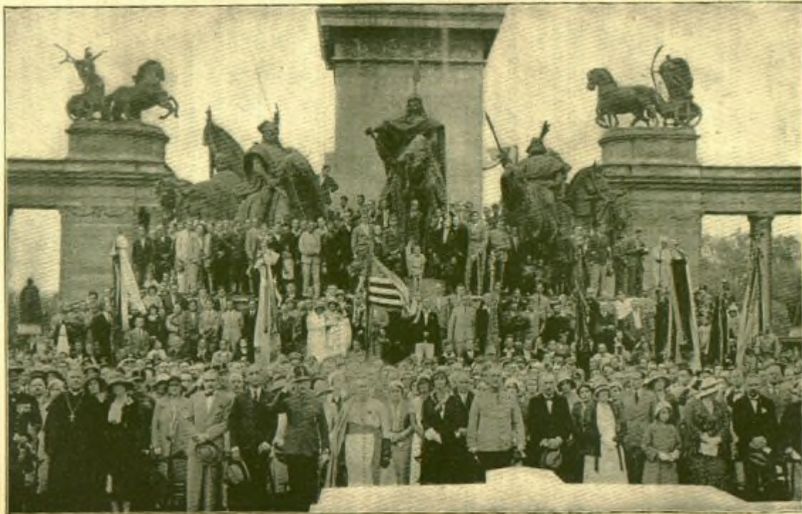
A hős óceánrepülőék ünneplése » milléniumi emlék előtt.