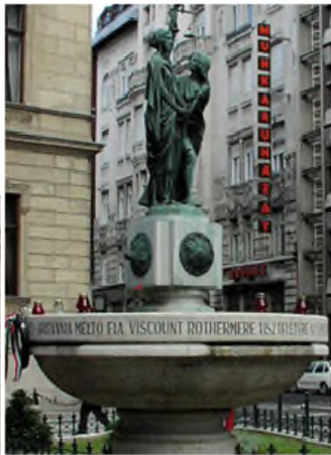
A Magyar Igazság Kútja